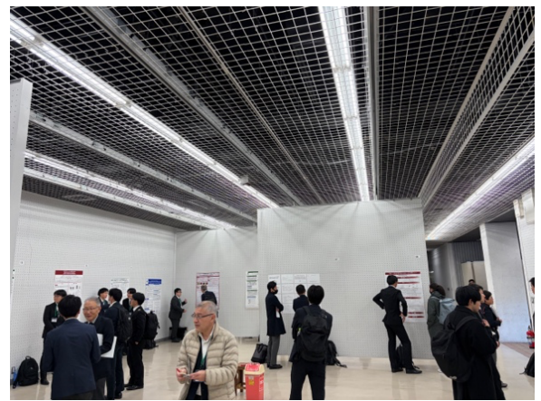
ポスター発表の様子