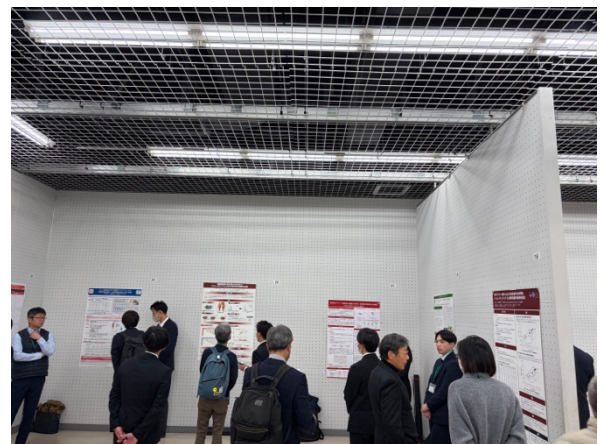
ポスター発表の様子